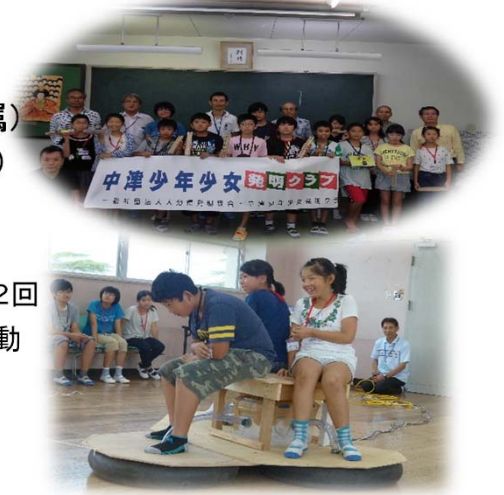
大型ホバークラフト:3人乗っても大丈夫