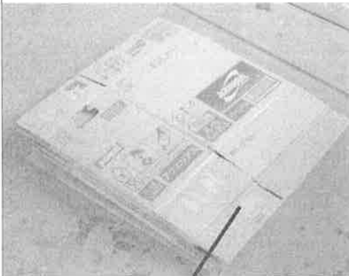
まとめて重ねている