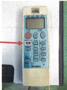
【押せなくなる Work: 装着時】